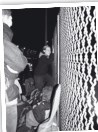
Pyro klettert in Nancy über den Zaun des Parks

jedoch nicht so freundlich gesinnt und es regnete, abgesehen von kurzen Unterbrechungen, durch. So machten wir uns auf, ins nächste Dorf, in dem es leider keinen Supermarkt gab, so dass Sonne und ich ins nächste Dorf zum Einkaufen trampeln mussten. Mit aufgefüllten, schweren Rucksäcken ging es dann weiter, natürlich bergauf und der Regen ließ auch nicht nach. So kamen wir irgendwann klitschnass an einer Berghütte an und ein paar Meter entfernt fanden wir eine Picknickhütte, in der wir dann schliefen. Am nächsten Tag ging es fröhlich weiter. Da es zwei Wegvarianten gab, wählten wir die kürzere ohne andere Kriterien zu berücksichtigen. Schnell ging es ziemlich steil bergauf und kurze Zeit später, der Weg war mittler-