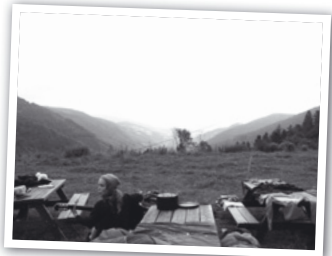
Picknickhütte 2. Tag

Als wir am 9. August nach wenig bis gar kein Schlaf aufstehen und das Lager abbauen mussten wir uns nicht, wie für fast alle anderen Lagerteilnehmer, mental auf die bevorstehende Heimreise einstellen. Denn wir hatten unsere Sommerfahrt noch vor uns und so machten wir uns nach erfolgreichem Abbau und der Verabschiedung der anderen auf den Weg. Übermüdet wie wir waren, kamen wir nur im Schneckentempo voran. Früh suchten wir uns einen Schlafplatz. Nach dem Essen war dann früher oder später Schlafen angesagt. Der nächste Morgen begann mit einem Adrenalinschock, da es regnete und wir also schnell ein Dach finden mussten. Als dies passiert war, machten wir es uns zunächst gemütlich und hofften, dass der Regen bald aufhören würde. Diesmal war der Fahrtengott uns